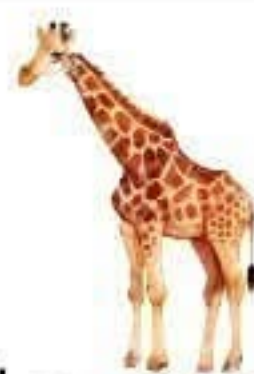
La gazelle L'éléphant Le chameau La girafe