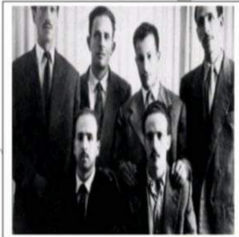
المجموعة الستة مفجري الثورة