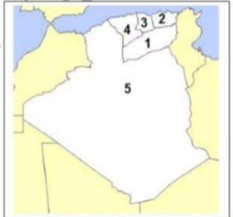
خريطة المناطق العسكرية قبل مؤتمر الصومام