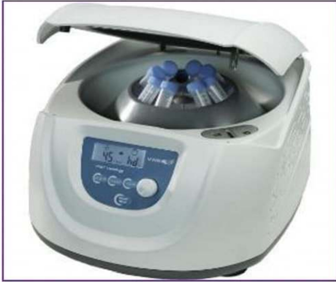
جهاز الطرد المركزي

يعتمد على تأثير القوة الطاردة المركزية الناجمة عن الدوران السريع للأنايب داخل الجهاز بحيث تدفع بالجسيمات الصلبة الناعمة إلى الاصطدام بجدار الأنبوب الموجودة بداخله فتفقد حركتها ومن ثم تسقط إلى أسفل الأنبوب فتركد .