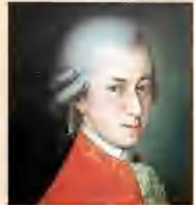
Wolfgang Amadeus Mozart (1791 – 1756)

Man feierte ihn erst viel später als großes Genie.