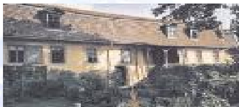
Goethes Haus in Weimar