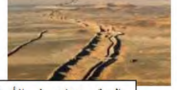
الموقع منخفض في الأصل

إعتمادا على السياق والسندات والمكتسبات السابقة :