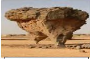
أشكال صخرية منحوتة