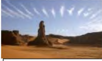
منخفضات بين الصخور