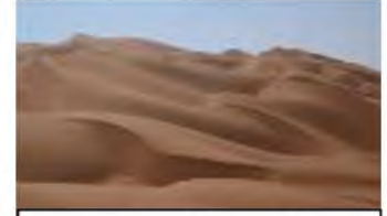
كثبان رملية متحركة