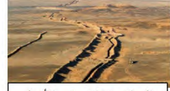
الموقع منخفض في الأصل

إعتمادا على السياق والسندات والمكتسبات السابقة :