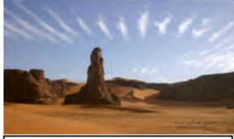
منخفضات بين الصخور