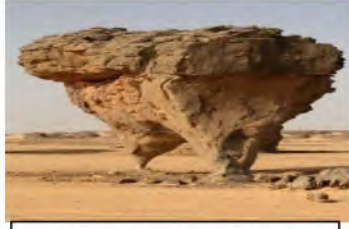
أشكال صخرية منحوتة