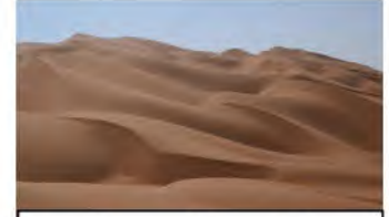
كثبان رملية متحركة