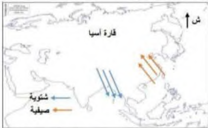
اتجاه الرياح الموسمية الصيفية و الشتوية في قارة آسيا

☞ رسم توضيحي لاتجاه الرياح الموسمية الشتوية و الصيفية في قارة آسيا . .