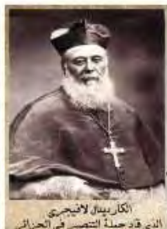
الكاردينال لانجيري الذي قاد حملة التنصير في الجزائر