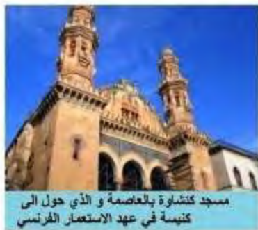
مسجد كتنشوة بالعاصمة و الذي حول الى كنيسة في عهد الاستعمار الفرنسي

السند: 02) (لقد وضعنا أيدينا على أموال الوقف و قضينا على مدارس و مساجد كانت موجودة...)) تقرير لجنة لاسكوتار الفرنسية 1878م