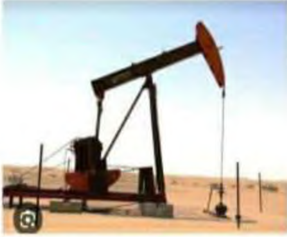
الشكل (1): تمثل الصورة نموذجا عن الحفارات المستعملة للحفر

في يوم 24 فيفري من كل سنة يحتفل الجزائريون بتأسيس المحروقات، أي استرجاع آبار النفط و الغاز من الاستعمار . في عام 2023 م انطلقت الأشغال لحفر بئر جديدة لاستخراج النفط في منطقة حاسي مسعود .