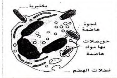
السند 1 الخلية البلعمية اثناء عملها