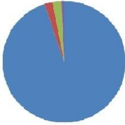
دائرة نسبة لوارادات الجزائر