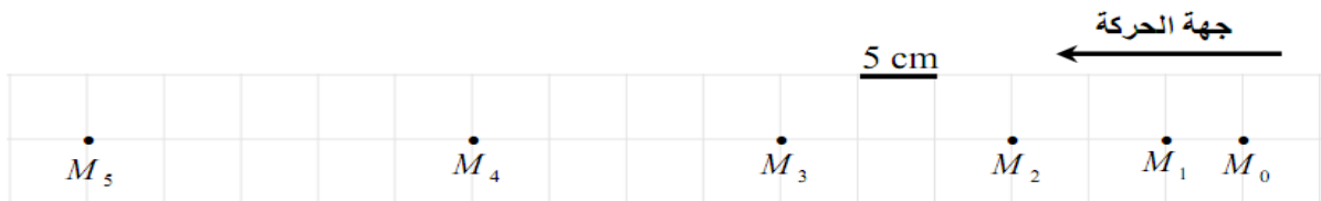
الشكل - 1

➤ يمثل الشكل التالي التصوير متعاقب لمتحرك، بحيث عند t=0 كان المتحرك في M_0 . زمن التسجيل هو \tau = 0,1 s