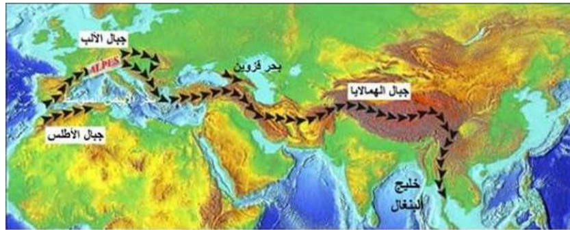
الوثيقة 4 : جزء من الحزام الزلزالي .