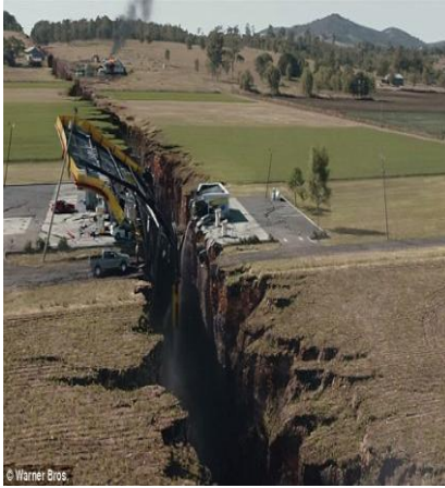
الوثيقة 3 : فالق