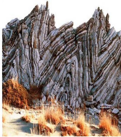
الوثيقة 2 : طيات