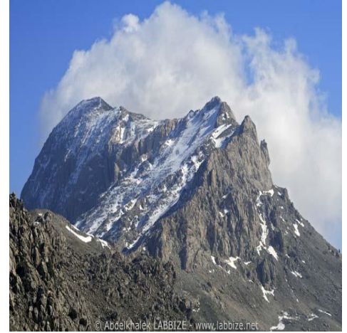
الوثيقة 1 : جبال جرجرة