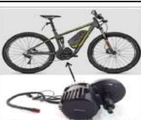
صورة لمحرك دراجة