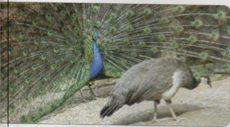
الطاووس الأزرق في رحلة زفاف