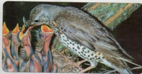
طائر السمان وصغاره