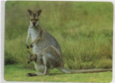
أنثى الكنغر مزودة بجراب بطني تحمل أربع حلمات يمكث صغيرها في جراب أمه