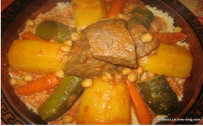
الوثيقة 02 : طبق الكسكسي الشهير .