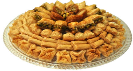
الوثيقة 03 : طبق من الحلويات الشرقية .

معتمدا على السندات المقدمة و مكتسباتك ، أجب عن التعليمات التالية :