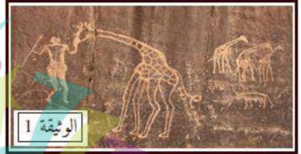
نقوش على صخور الطاسيلي