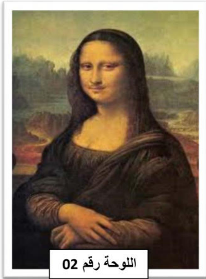
اللوحة رقم 02

السؤال الثاني: تأمل الصور التالية و أكمل الجدول التالي: