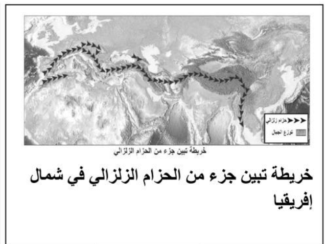
خريطة تبين جزء من الحزام الزلزالي في شمال إفريقيا