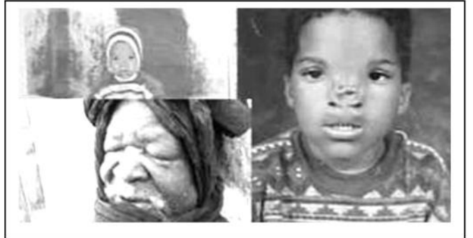
الوثيقة(1): صورة لعائلة متضررة من التجارب النووية

( ... و رصد باحثون كثيرون تأثير تلك التجارب على صحة الإنسان و البيئة في الصحراء الجزائرية، حيث أن الإشعاع النووي يخرّب البرنامج الوراثي للكائن الحي، و الأخطر من ذلك ما يتركه من تشوهات خلقية تصل إلى الأجنة في الأرحام تظهر على شكل أمراض و تشوهات لا تقف عند جيل معين... )