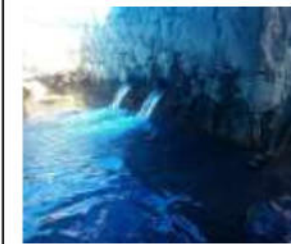
المخزون الطبيعي للمياه الجوفية