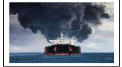
مظاهر التلوث البيئي