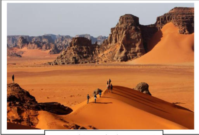
السند 2 : منظر طبيعي بالطاسيلي

لايمكن تفسير هذا التنوع إلا بمعرفة مدى تأثير الدينامية الخارجية للكرة الأرضية