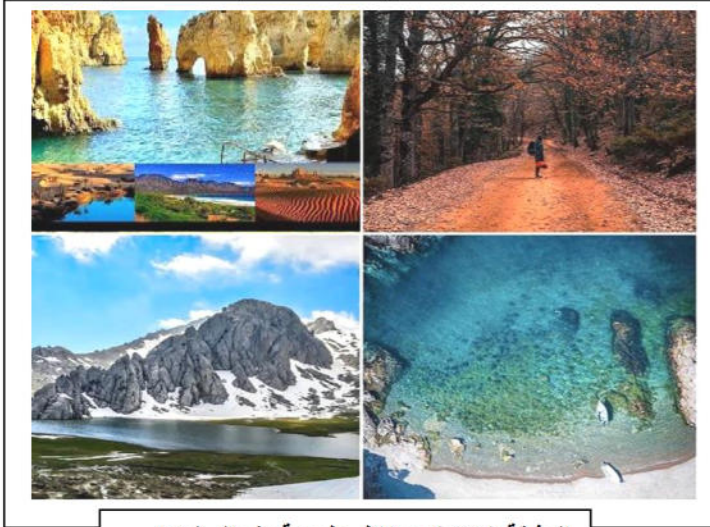
الوثيقة ( 03 ) : مناظر طبيعية بشمال الجزائر

الوضعية الثانية ( 06 نقاط ) : تتميز الجزائر بتنوع مناظرها الطبيعية على طول مساحتها واختلاف هذه المناظر في المنطقة الواحدة , كما هو في الوثيقة ( 2 , 3 )