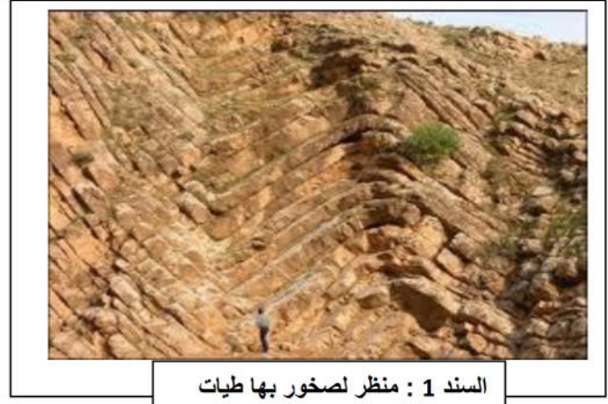
السند 1 : منظر لصخور بها طيات