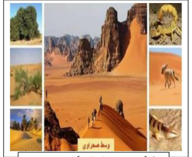
الوثيقة ( 02 ) : مناظر طبيعية بصحراء الجزائر