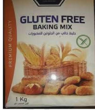
غذاء خال من الغلوتين

السيليك مرض يصيب الأمعاء الدقيقة بسبب الحساسية لبروتين الغلوتين (Gluten) الموجود في دقيق القمح، يتسبب الغلوتين في التهاب جدار الامعاء الدقيقة وإتلاف الزغابات المعوية.