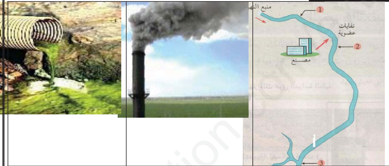
السند 2 / صور التلوث