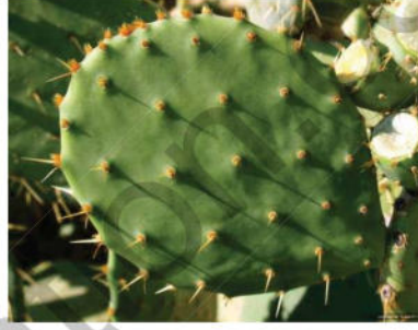
نبات التين الشوكي