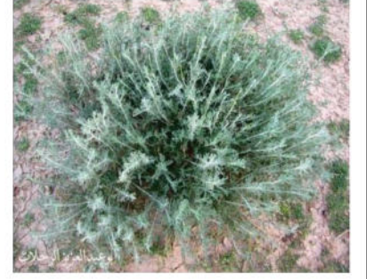
نبات الصنوبر الحلبي

التعليمات : بالإعتماد على السندات و مكتسباتك القبلية .