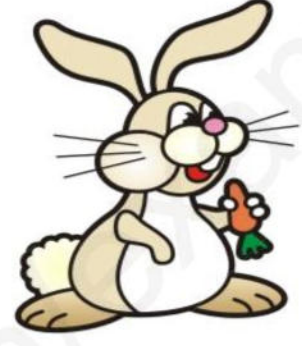
سند1: أرنب يتناول الجزر