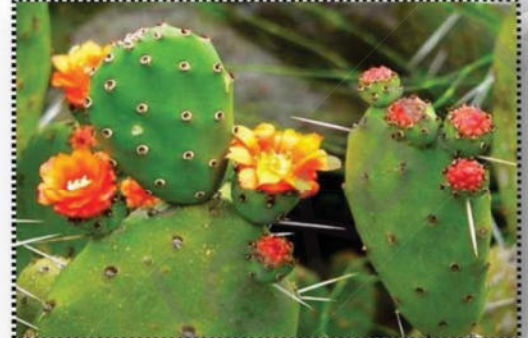
السند 01 : نبات التين الشوكي

التعليمات: من خلال النص و السندين و معلوماتك