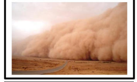
1/ عاصفة رملية تنقل الرمال المفككة

1- اذكر المركبات الاساسية للمناظر الطبيعية .