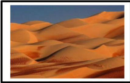
الوثيقة -3- كتبان رملية

يسود الصحراء الجزائرية المناخ الصحراوي الذي يتميز بندرة الامطار , و اختلاف درجة الحرارة بين الليل و النهار و الزوابع الرملية .