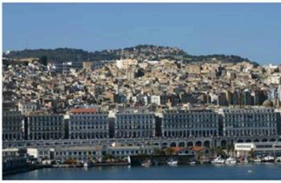
الوثيقة - 4 -