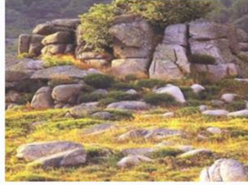
الوثيقة - 3 -