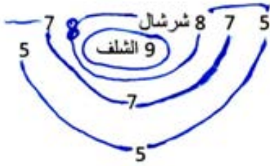
الوثيقة - 1