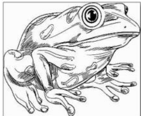
السند 1: صورة لضفدع

- لدراسة أنماط التنفس عند البرمائيات ، أنجزت التجارب التالية على الضفدع و كانت النتائج كالتالي :