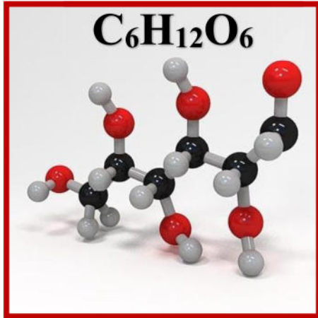
الوثيقة 2: سكر الغلوكوز

- اذكر بعض الاحتياطات الوقائية أثناء استعمال المحاليل الحمضية. 1 ن