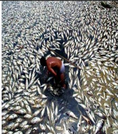
سند 2 / البترول مصدر للتلوث