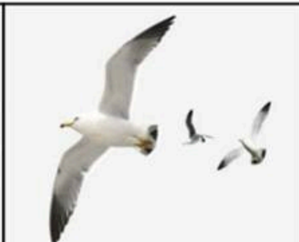
السند 03: بعض المفترسات