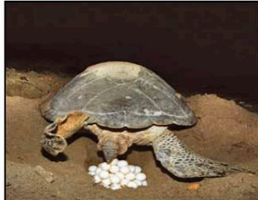
السند 01: سلحفاة تضع البيوض