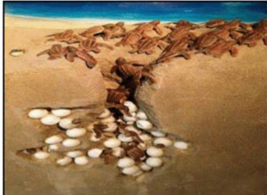
السند 02: سلاحف صغيرة متجهة الى البحر بعد الفقس

ملاحظة: توظيف السندات أمر ضروري. كما يعتبر السياق (النص) من السندات أيضا..... بالتوفيق : الاستاذ د / زهير