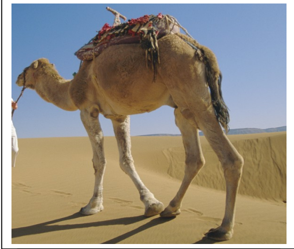
صورة لأحد أنواع الإبل (الجمل العربي)

في هذه الآية الكريمة يخص الله سبحانه وتعالى - الإبل من بين مخلوقاته الحية , ويدعونا إلى التفكير والتأمل في خلقها , باعتبارها خلقاً دالاً على عظمة الخالق - سبحانه وتعالى - وكمال قدرته وحسن تدبيره.