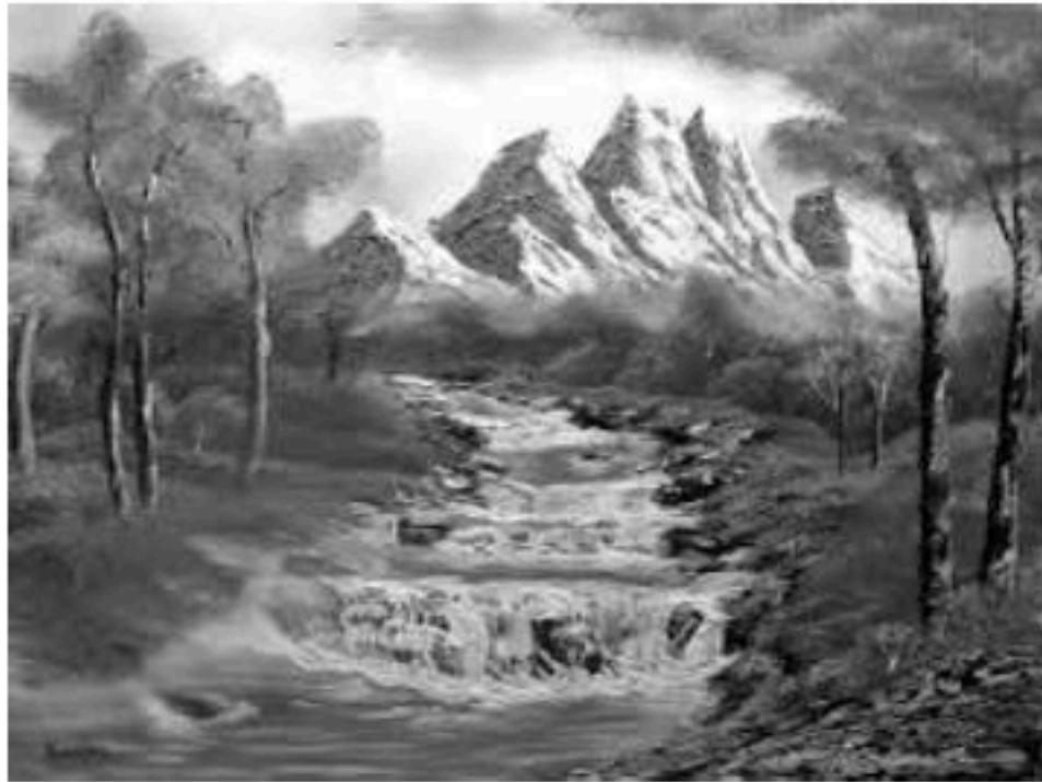
منظر لجبال الأطلس التلي

الوضعية الإدماجية: ( 08 نقاط ) طلب الأستاذ من التلاميذ جمع صور لتتنوع المناظر الطبيعية في الجزائر فاختر أحد التلاميذ هاتين الصورتين: