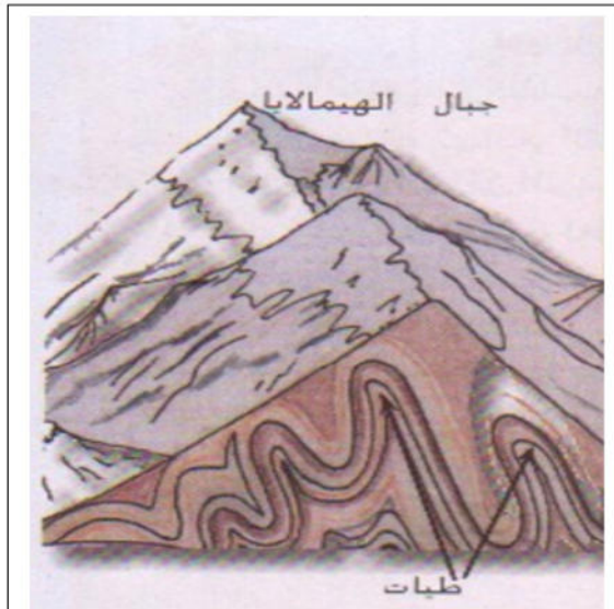
مقطع لجبال الهيمالايا