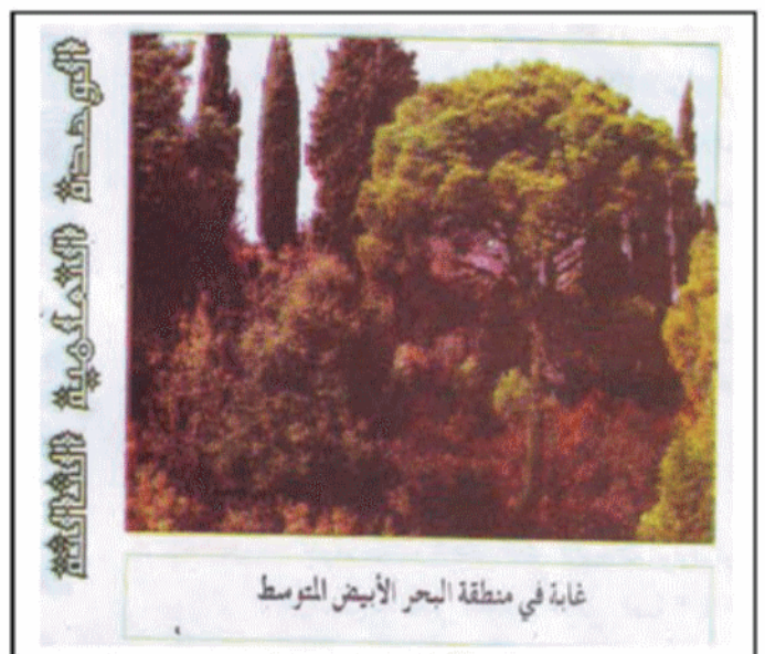
غابة في منطقة البحر الأبيض المتوسط

التعليمة: أكتب فقرة توضح من خلالها العلاقة و التكامل بين المظاهر الطبيعية في الجزائر و انعكاسها على