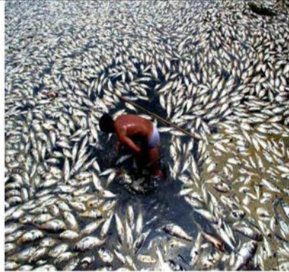
سند 2 / البترول مصدر للتلوث