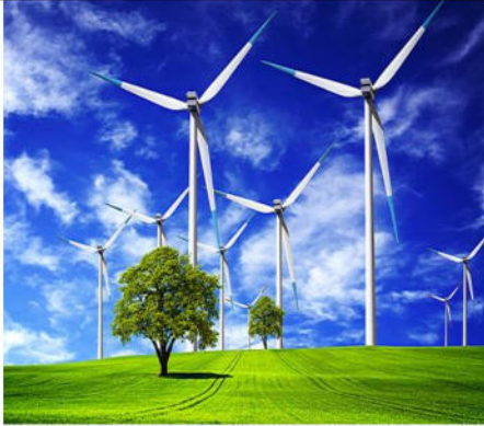
سند 3 / استغلال طاقة الرياح