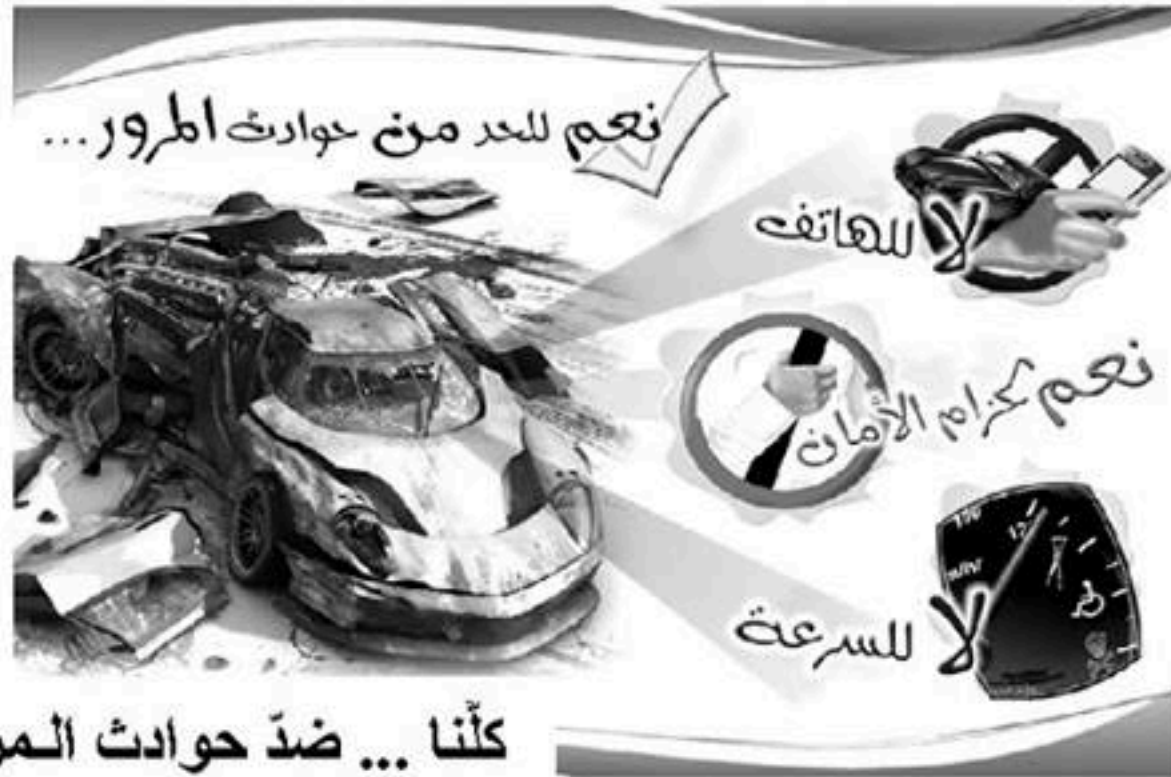
كلنا ... ضد حوادث المرور