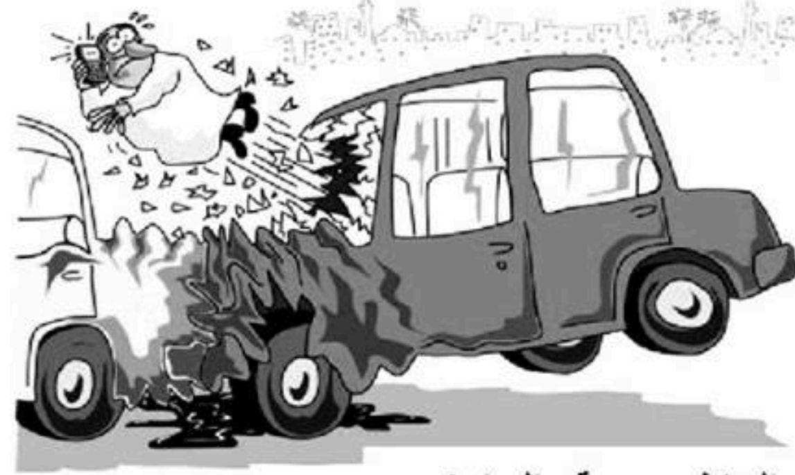
بسبب الهاتف ... وقع الحادث

⊙ التعلّيمية: اكتب مقالا - في صفحة - لتشارك به أصدقاءك على الفيس بوك ، تتحدث فيه عن ظاهرة حوادث المرور