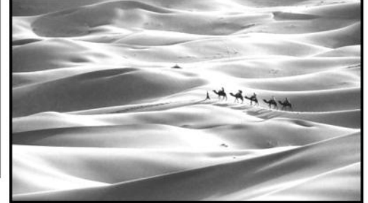
السند-1- العرق ( صحراء من الكثبان رملية