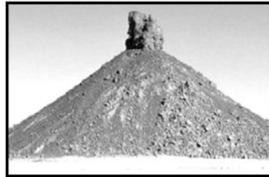
السند-5- بركان خامد من الهقار

التعليمة: بالاعتماد على معارفك و السندات :