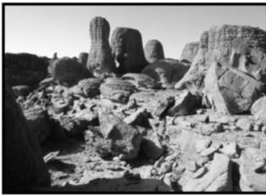
السند-4- منظر من الهقار