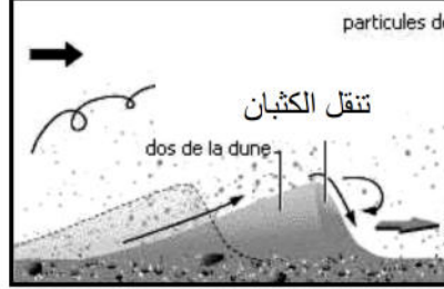
السند-2- تأثير الرياح