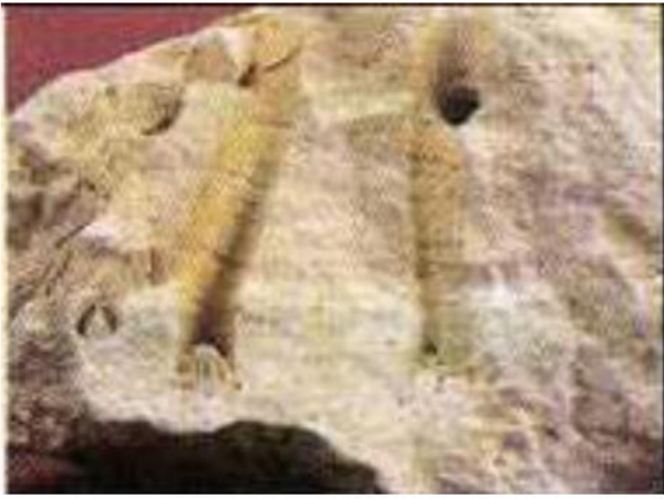
الوثيقة 02: جزء من مستحاثة المرجان

أثناء أشغال البناء العمراني صادف العمال وجود بعض الارصفة المرجانية المتحجرة، قدر علماء المستحاثات عمرها بألاف السنين.