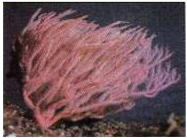
الوثيقة 01: مرجان حالي