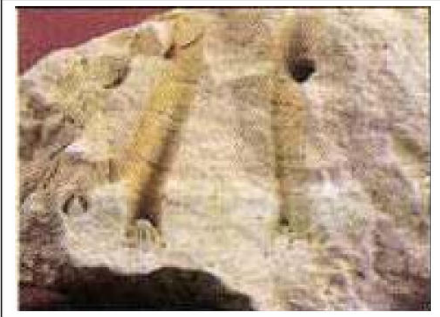
الوثيقة 02: جزء من مستحاثات المرجان الموجودة في بشار

أثناء أشغال البناء العمراني في منطقة بشار صادف العمال وجود بعض الارصفة المرجانية المتحجرة ، قدر علماء المستحاثات عمرها بألاف السنين .