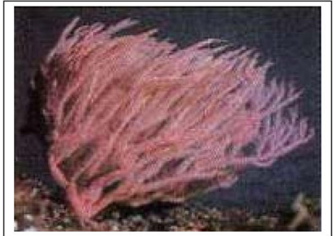
الوثيقة 01: مرجان حالي