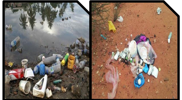
الوثيقة-3- رمي النفايات بعد نزهة الصيد

اعتماداً على ما درست و السندات المرفقة :