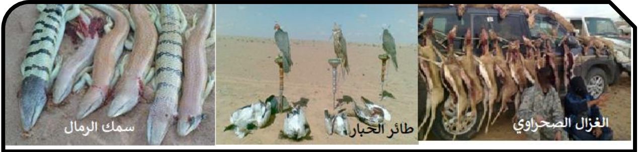
الوثيقة-2- الصيد الجائر للحيوانات النادرة