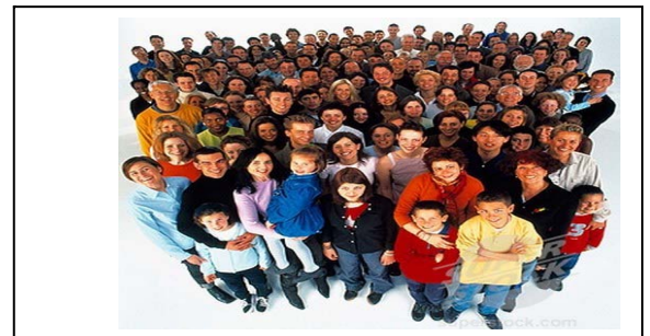
السند -3 :-

التعليمة: بالاعتماد على السندات المقدمة ( 4.3.2.1 ) و مكتسباتك القبلية ، اكتب فقره من 12 إلى 15 اسطر تبرز فيها مراحل تطور السكان في الجزائر ؟