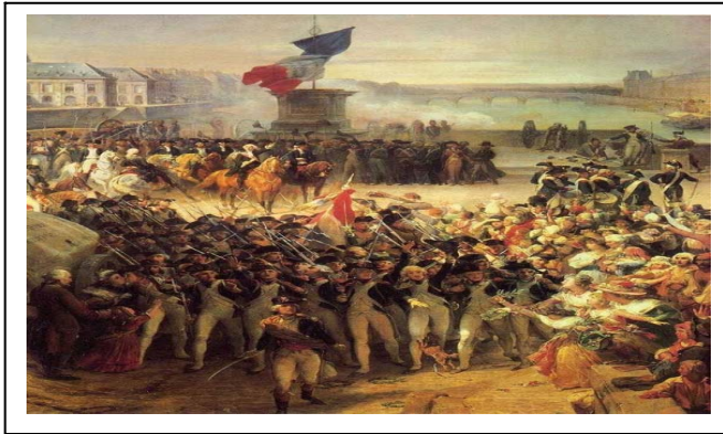
السند -2 :-