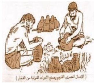
عصور ما قبل التاريخ