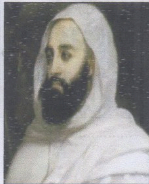
الأمير عبد القادر