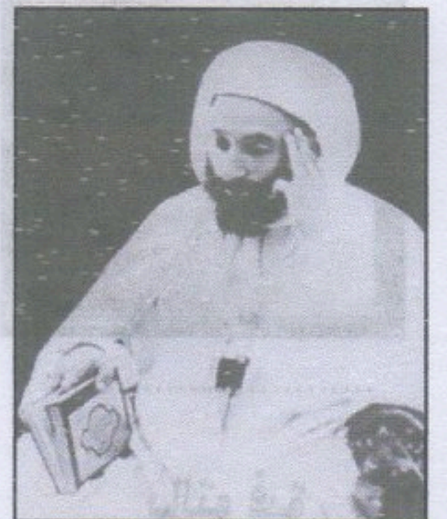
عبد الحميد بن باديس