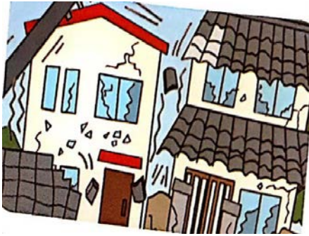
Un tremblement de terre

Un tremblement de terre a frappé ton ancien quartier. Les gens avaient trop peur. Les enfants couraient à gauche et à droite. Les murs des maisons et des immeubles se sont fissurés. les vitres des fenêtres se sont brisées. Les gendarmes et les policiers ont barré la rue pour laisser le passage à l'ambulance. Les pompiers sont enfin arrivés pour secourir les blessés.