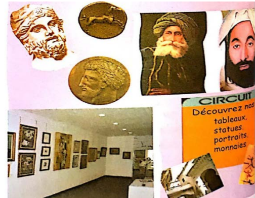
Musée des beaux- arts