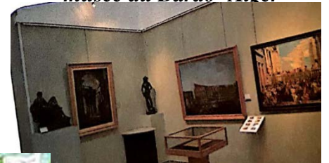
musée du Bardo -Alger-