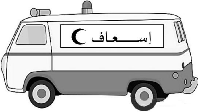
سيارة الاسعاف من الخارج